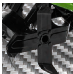
DOPPIE LAME A 4 PUNTE